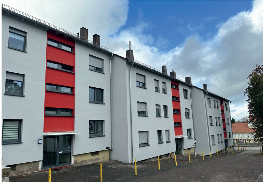
An der Ziegelhütte 4-8

In unserer letzten Ausgabe konnten wir stolz den Start der Baumaßnahmen des Sanierungsprojektes An der Ziegelhütte 4-22 verkünden. Es waren Bilder vom eingerüsteten Block Hausnummer 4-8 abgebildet. Jetzt können wir schon Bilder der neu gestalteten Fassade zeigen.