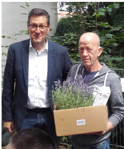
Sommerfest Berliner Ring 88