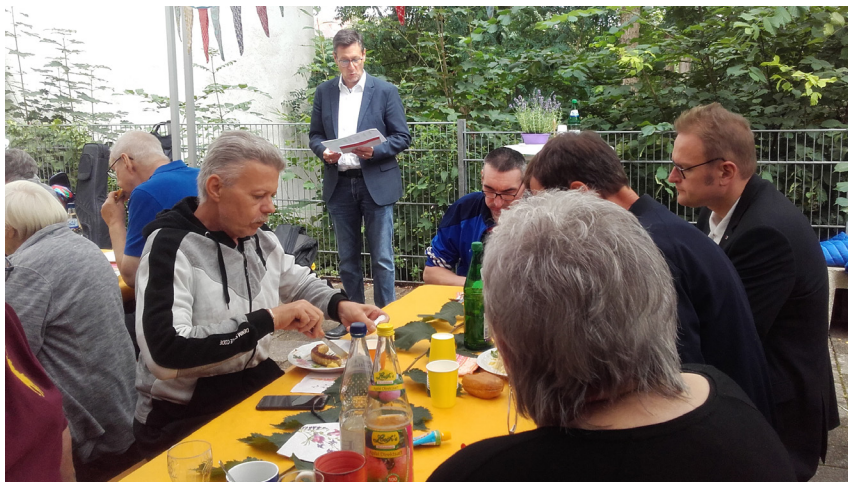
Sommerfest Berliner Ring 88