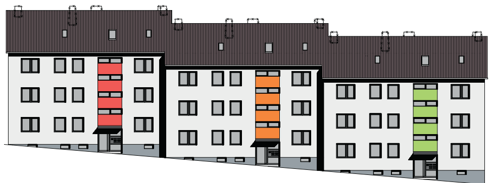
Fassadenkonzept (Vorderseite) Architektenbüro Wilhelm