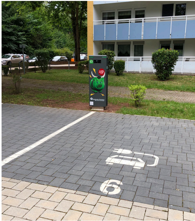
Stellplatz mit Ladesäule am Berliner Ring 82

Langsam, aber sicher halten E-Autos und E-Bikes immer mehr Einzug in den Alltag der Menschen. Auch und insbesondere im Wohnumfeld ist es daher wichtig, entsprechende Angebote zu schaffen. Die Bauhilfe Pirmasens setzt hier an und überdenkt ganze Quartiere unter Einbezug intelligenter Mobilitätskonzepte.