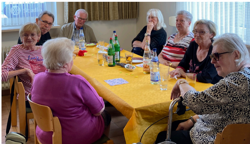
Sommerfest Adam-Müller-Straße 45