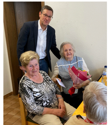
Sommerfest Adam-Müller-Straße 45

Im Spätsommer grillte und feierte die Bauhilfe am 21. September 2023 mit ihren Mieter*innen im Seniorenwohnhaus in der Adam-Müller-Straße 45. Die Bewohnerinnen und Bewohner kamen im Gemeinschaftsraum des Hauses in feierlicher Stimmung zusammen. Zu den gegrillten Würsten und Steaks gab es di-